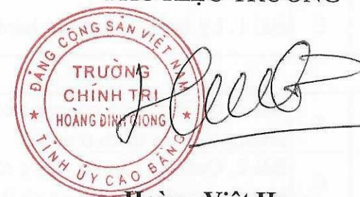
Hoàng Việt Hưng