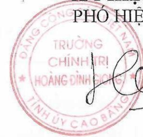
Hoàng Việt Hưng