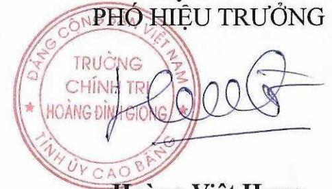
Hoàng Việt Hưng