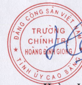
Hoàng Việt Hưng