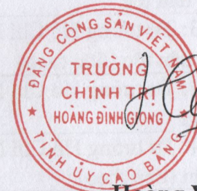
Hoàng Việt Hưng