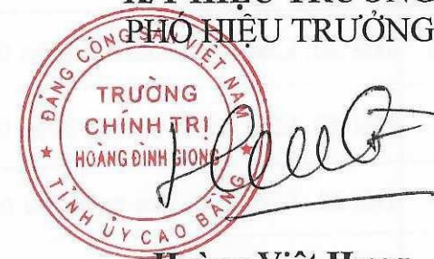
Hoàng Việt Hưng