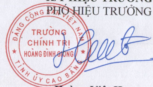
Hoàng Việt Hưng