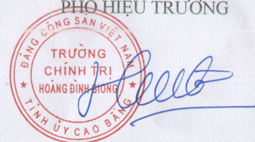
Hoàng Việt Hưng