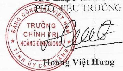
Hoàng Việt Hưng