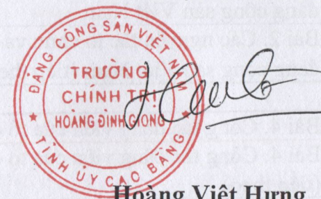
Hoàng Việt Hưng